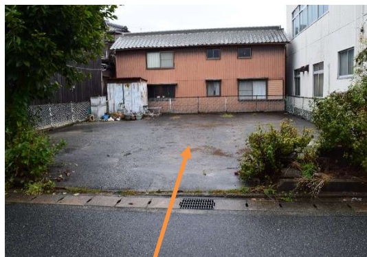
購入した駐車場敷地